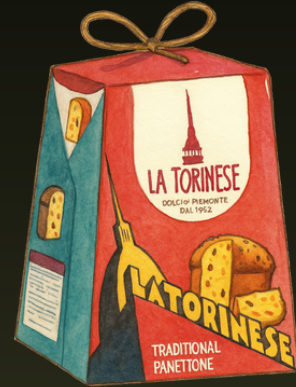
PANETTONE CLASICO ESTUCHE 100G $21.000