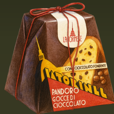
PANDORO CON GOTAS CHOCOLATE 1KG $140.000