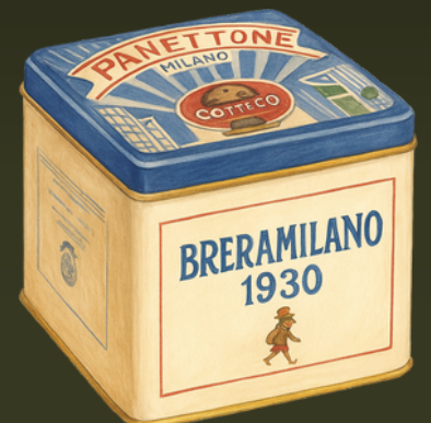
PAN PANETTONE CLÁSICO 1120G LATA $199.000