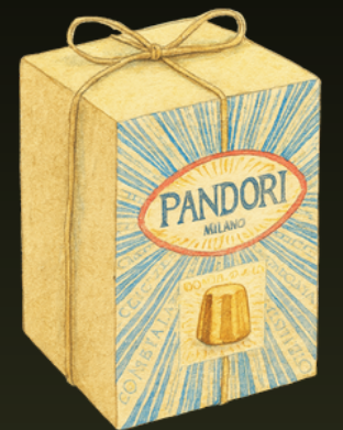
PAN PANDORO CLASICO 80G / 100G $24.000