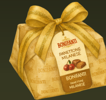
PANETTONE CILIEGIA CIOCCOLATO 1000G $165.000