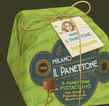
PANETTONE CON PISTACHO 1KG $199.000