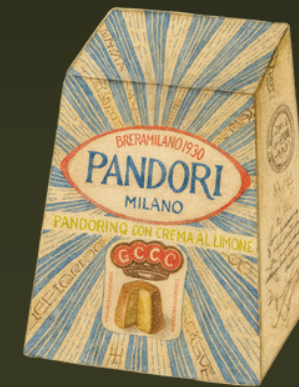
PAN PANDORO LIMONCELLO 100G $24.000