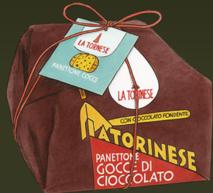
PANETTONE CON GOTAS CHOCOLATE 1KG $140.000