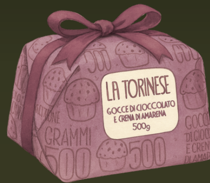
PANETTONE GOTAS CHOCOLATE Y AMARENA 500G $74.000