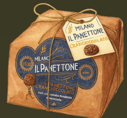
PANETTONE CON CHOCOLATE 1KG $199.000