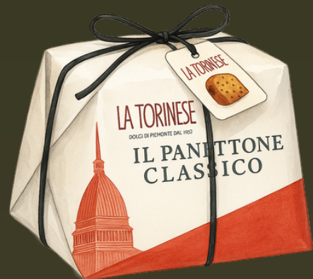
PANETTONE CLASICO EMPAcado A MANO 1KG $140.000