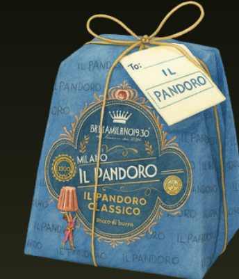
PANDORO CLASICO 1KG ANTICA OFFELLERIA $199.000