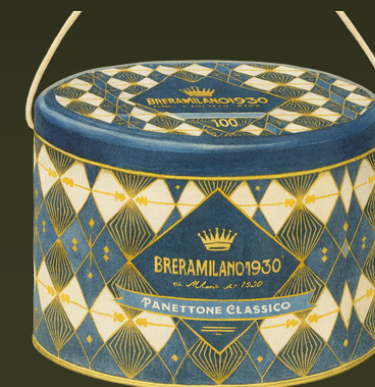
PAN PANETTONE CLÁSICO 1000G LATA ART DECO $199.000