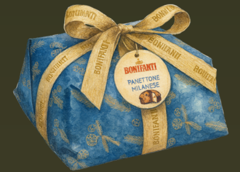
PANETTONE MILANESE BASSO INCARTATO KRAFT RETRÒ $165.000

Un solo corte, y la casa huele a navidad