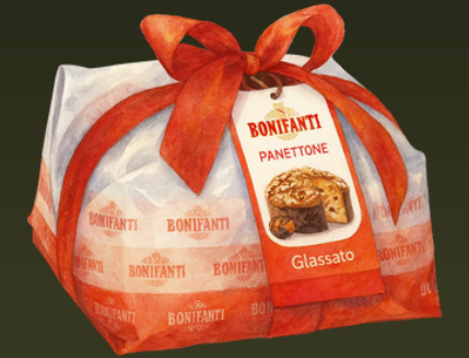
PANETTONE CLASSICO GLASSATO 1000G $165.000