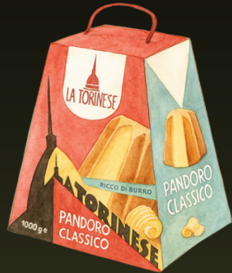
PANDORO 1000G $123.000