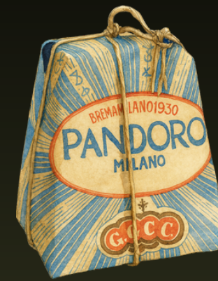
PANDORO CLASICO 1KG $199.000