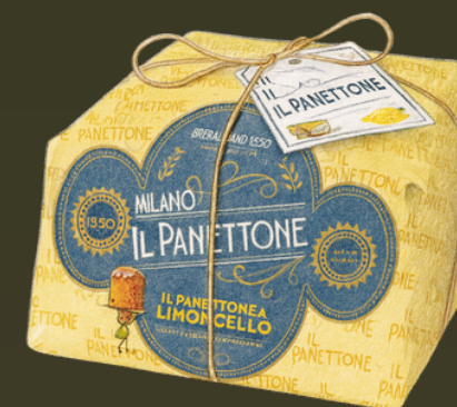
PANDORO CON LIMONCELLO 100G $199.000