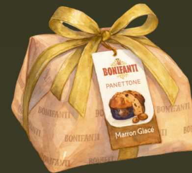
PANETTONE MARRON GLACES 1000G $165.000