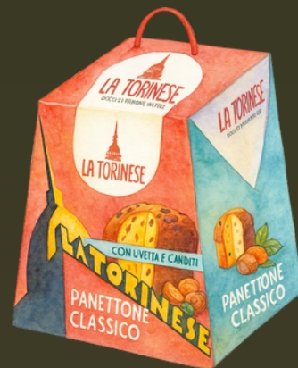
PANETTONE CLASICO ESTUCHE 1KG $99.000